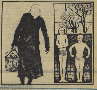
Рис. Ю. ЗАЛЬМАНА

И тут в дверях показался тренер. (Продолжение следует)