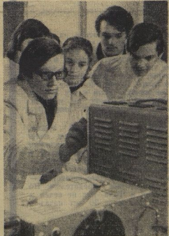
Москва, школа № 7.

Идёт третья четверть. У шестиклассников — урок немецкого языка. Посмотрите, как сосредоточенно слушают они через наушники текст. Прочитайте на тактих уроках отрывки вывески до точности. А чем заняты девятиклассники? Они изучают новые приборы в радиотехнической лаборатории. Ну, а семиклассники помогают изучать зоологию пернатые.